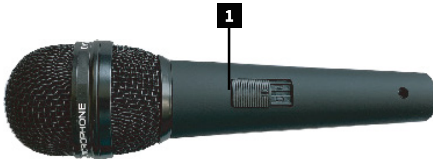
1 ON / OFF 스위치