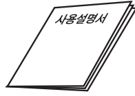
1. 사용 설명서